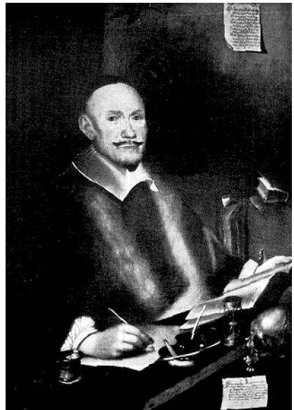
Johann Crüger (1598 - 1663)