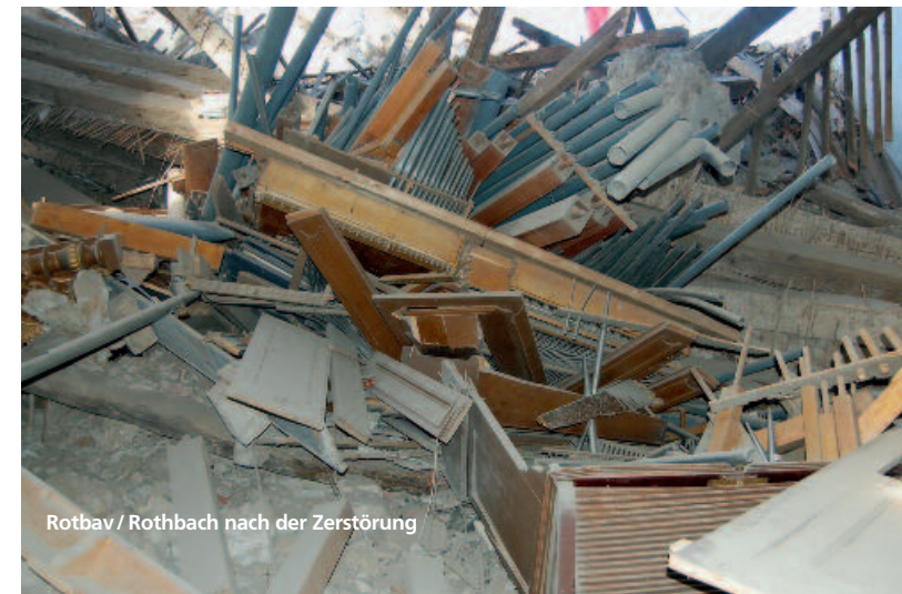
Rotbav / Rothbach nach der Zerstörung