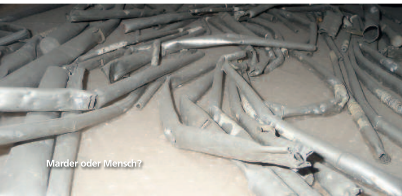
Marder oder Mensch?

Ähnliches geschah 5 Tage zuvor in Roades / Radeln . Hier war ebenfalls ein Turm eingestürzt und hatte die Orgel (11 Reg. von Petrus Gottlieb Schneider, 1838) in Mitleidenschaft gezogen. Hier waren schon vorab Schäden im Instrument zu verzeichnen – man weiß nicht, ob es Marder waren, die hier zubissen, oder Menschen, die hier „aktiv“ waren. Das Instrument ist mittlerweile abgebaut und dadurch gesichert, dass es – wie weitere drei Orgeln – auf die Seiteneempore der Schwarzen Kirche in Braşov / Kronstadt ausgelagert wurde und seines Wiederaufbaus harret. Doch dafür fehlen Gelder, viele Gelder.