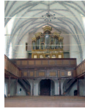
Saschiz / Keisd