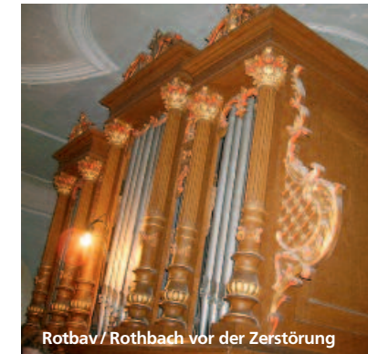
Rotbav / Rothbach vor der Zerstörung